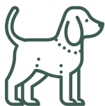
Chien non catégorisé