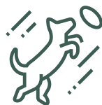
Zone de liberté canine