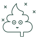
Sac à déjection canine