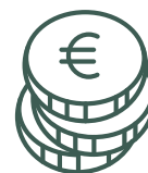
Coût supplémentaire demandé