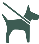
Chien en laisse